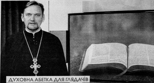
ДУХОВНА АБЕТКА ДЛЯ ГЛЯДАЧІВ

Спархіяльний передачу на «12 каналі» відзначено міжнародною журналістською асоціацією «Новомедіа» за висвітлення християнських і сімейних цінностей.